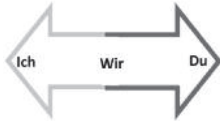
Abb. 4: Beziehungseinheit von Ich-Du-Wir

zurück und versuche mir vorzustellen, wie ich überhaupt dazu gekommen bin, mir selbst zum Gegenstand zu werden, so sieht es so aus, als hätte ich nur dadurch gelernt, mich selbst beim Namen zu rufen und von mir am Ende als einem ›Ich‹ zu denken und zu sprechen, daß die anderen mich beim Namen genannt, ich diese Anrufe meiner selbst in mir repräsentiert und dann mit Hilfe einer Repräsentation meiner selbst in mir nachgemacht habe. So habe ich gelernt, mich zu mir selbst zu verhalten, wie die anderen sich zu mir und zu sich verhalten. Mein Selbst wurde konstituiert durch Repräsentanz DER ANDEREN in mir und ist jetzt konstituiert dadurch, dass WIR IN MIR repräsentiert sind.« 33