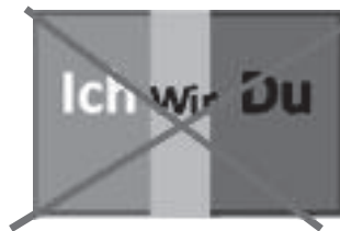
Abb. 3: Wir als Ich-Du-Schnittmenge